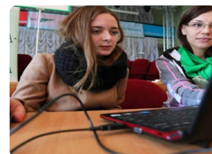
Запущена первая российская социальная сеть для профессиональных контактов