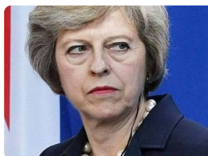
«Безумию Мэй» есть вполне рациональное объяснение