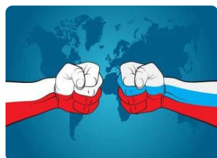
Почему поляки холодно относятся к русским