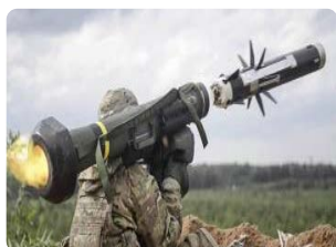
«Джавелины» уже доставлены на Украину, но ВСУ их не получили