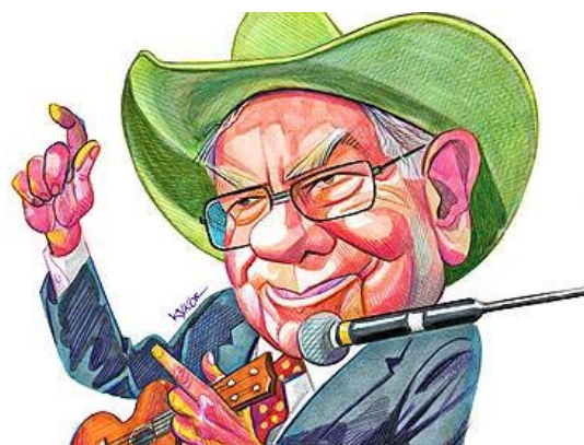
Уоррен Баффет в десяти цитатах Так говорил глава Berkshire Hathaway

Как пояснили “Ъ” юристы Давид Кухалашвили и Михаил Загайнов, представляющие интересы ряда родственников погибших и пострадавших в тюменской авиакатастрофе, еще «в ходе подготовки к судебным разбирательствам было установлено, что данная модель ATR-72 имела конструктивный недостаток в регулировании обледенения на крыльях». По их словам, это обстоятельство позволило истцам, которые изначально не согласились на предложенные им в России суммы компенсаций, привлечь компанию-производителя как соответчика. Отметим, что обязательные страховые выплаты, а также материальную помощь от властей все пострадавшие получили (всего до 3 млн руб. на каждую семью). При этом им, как стало известно “Ъ”, от