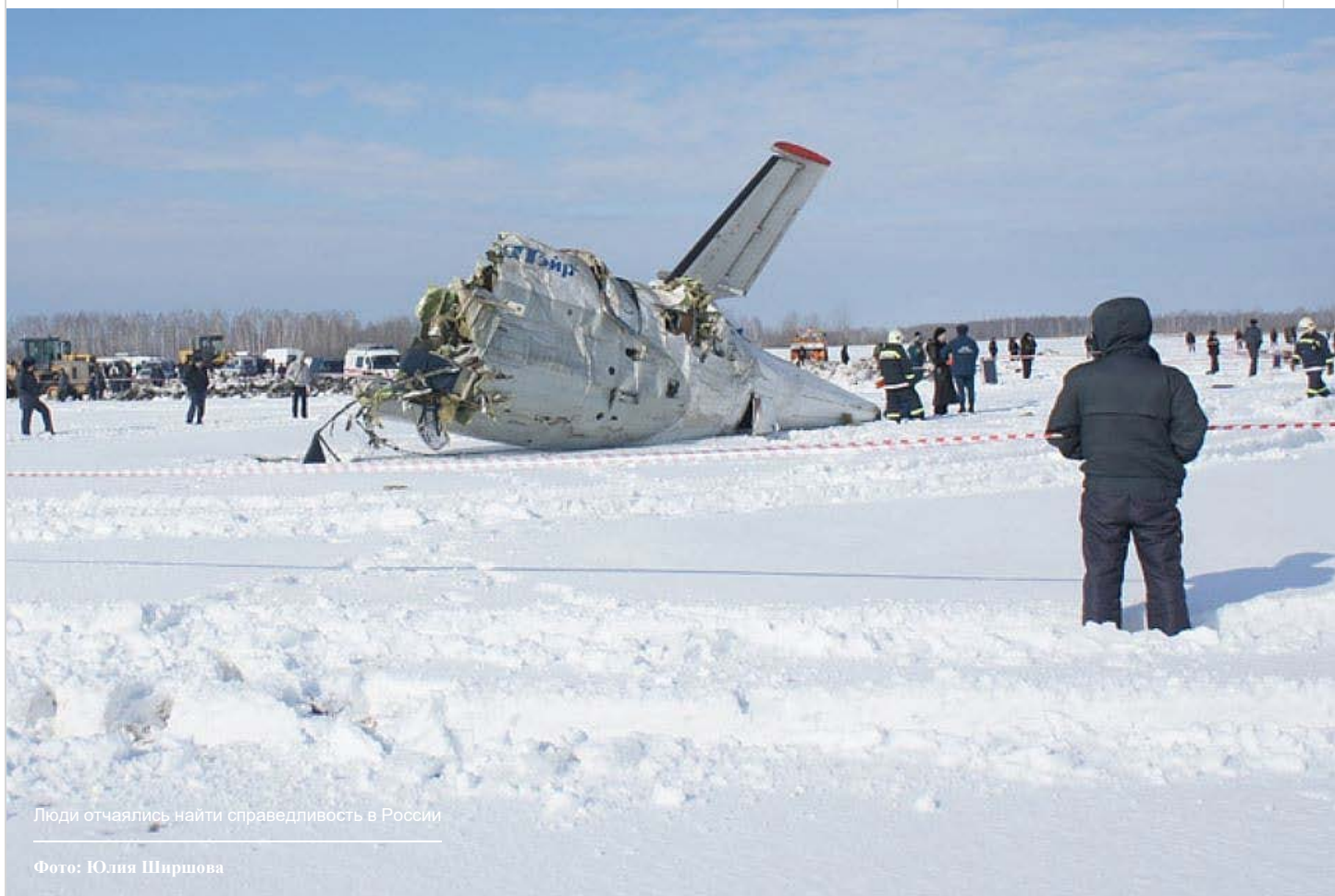
Люди отчаялись найти справедливость в России