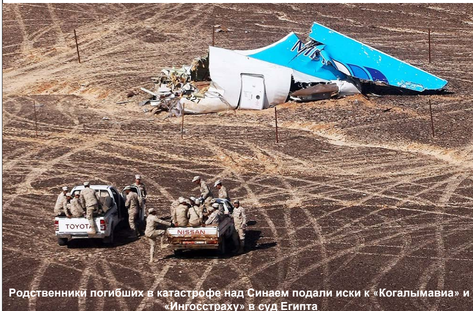
Родственники погибших в катастрофе над Синаем подали иски к «Когалымавиа» и «Ингосстраху» в суд Египта