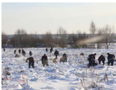
Сейчас на месте авиакатастрофы идут поисковые работы

зависит от дохода погибшего, чем больше зарабатывал погибший, тем больше будет сумма выплат для иждивенцев», — уточнил юрист. Также перевозчик обязан компенсировать стоимость билета, багажа и погребения.